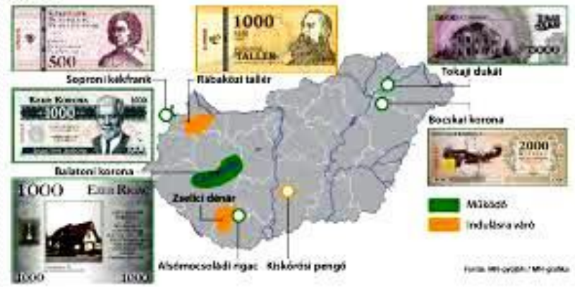
Helyi pénzek és terveik Magyarországon 2016-ban